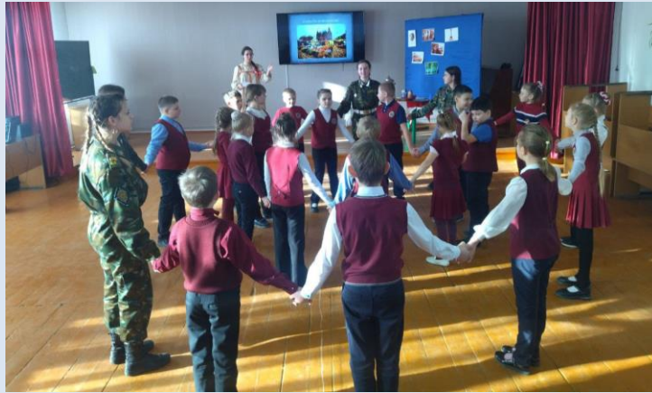
Момент мероприятия с учащимися 3 класса.

женой, купец с продавцом, несмышленный балагур Петрушка, привлекали даже дрессированных медведей.