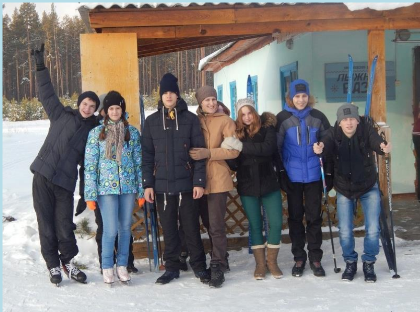
Начало каникул 8К класса на лыжной базе

- Несмотря на то, что часть каникул я провела в больнице, мне они понравились. А все потому, что меня каждый день навещали друзья. Очень чувствовалась и была приятна поддержка с их стороны. А когда я была выписана из больницы, мы с друзьями много проводили времени на свежем воздухе: ходили на каток, на горку.