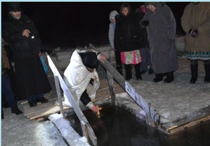
Освещение крещенской купели

- Перед тем, как войти в воду, приходят мысли о том, нужно ли? Но, когда ты начинаешь погружаться, время просто летит, ты пытаешься главное это ужасный холод! И ты буквально покрываешься льдом.