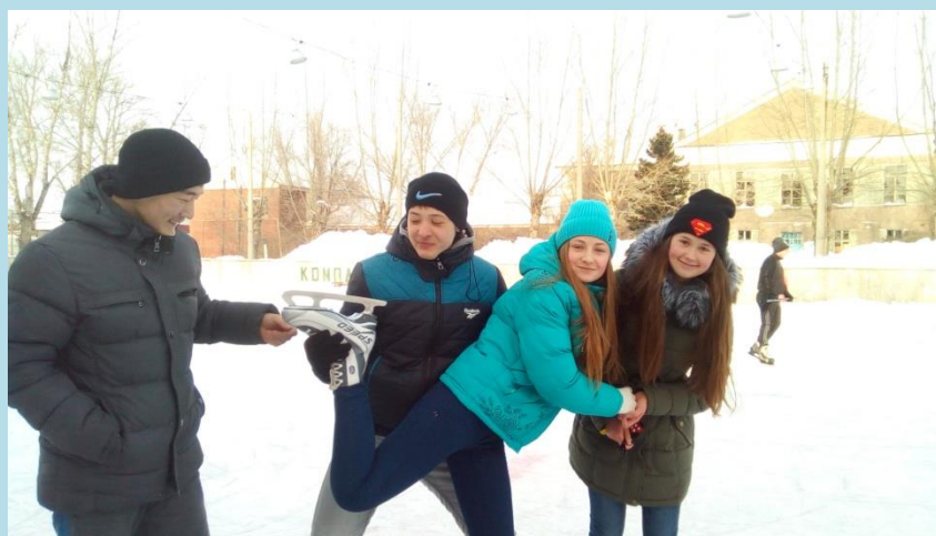
9А класс на зимних каникулах разделился по интересам