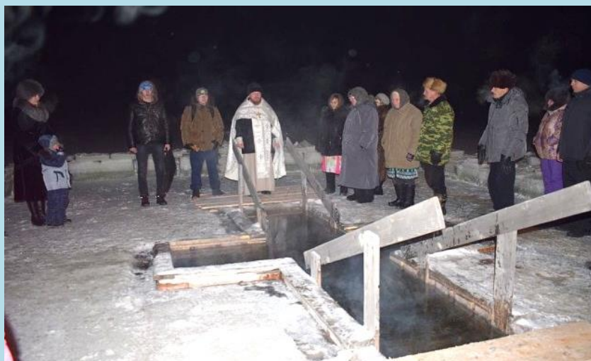
Освещение крещенской купели

- А много людей хотят погрузиться в воду?