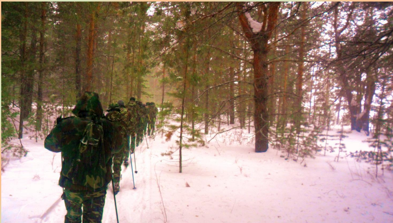
Дорога к памятнику