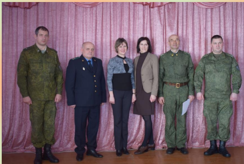
Преподаватели лицея с гостями