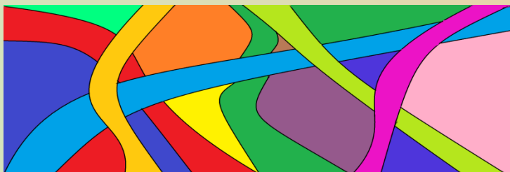
Коллаж Анастасии Андрейченко

ра работ ребята узнали много нового и необычного о нашем крае, малой родине. Показ видеороликов вызвал у всех только положительные эмоции.