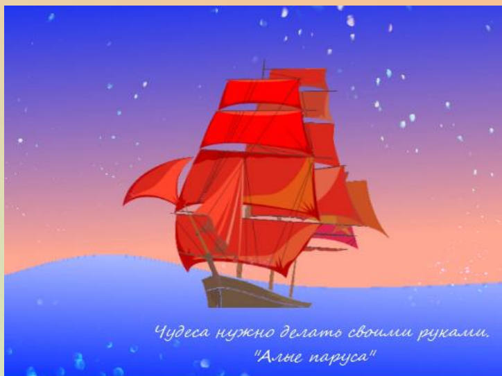
Рисунок Валерии Талочкиной

Все просто: если ты возьмешь в руки штатив и видеокамеру, у тебя появляется страстное желание заниматься этим увлекательным делом. Процесс съемок, пожалуй, самый захватывающий и интересный. Восьмиклассники отнеслись с огромной ответственностью к проекту. Конечные работы были действительно интересными и познавательными. В ходе просмотр-