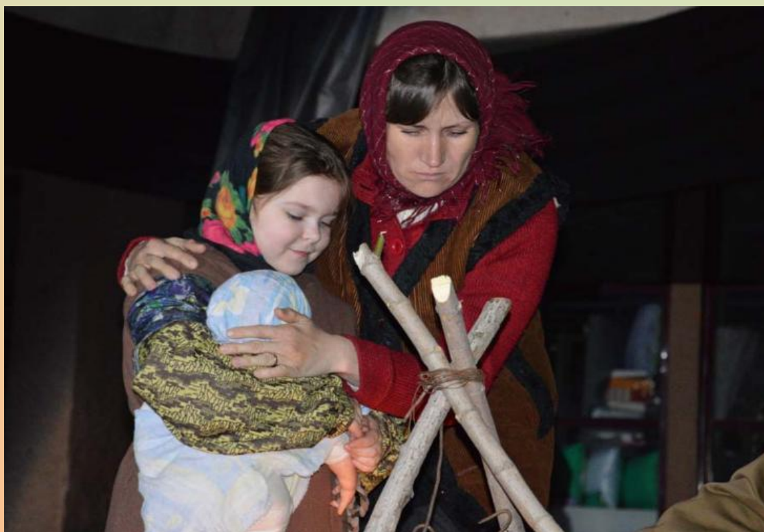
Дети на войне

взорвалась бурными неистовыми аплодисментами, которые еще долго не смолкали.