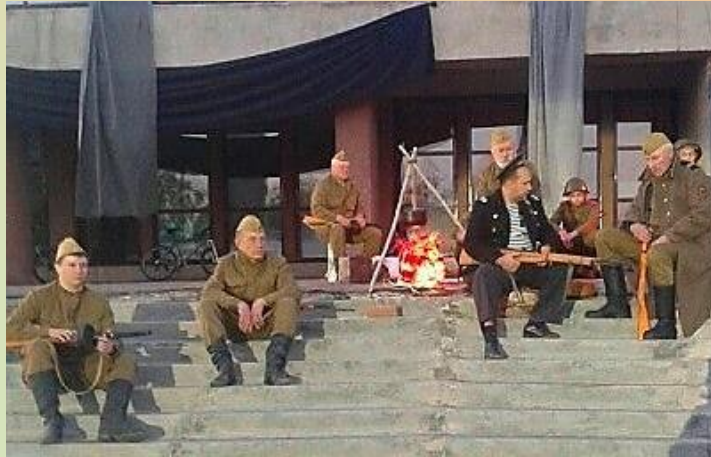
Бойцы на привале

Уже с самого начала дня всё население было окутано атмосферой предвкушения большого и яркого события. Погода была солнечной и теплой; все аллеи, скверы и парк