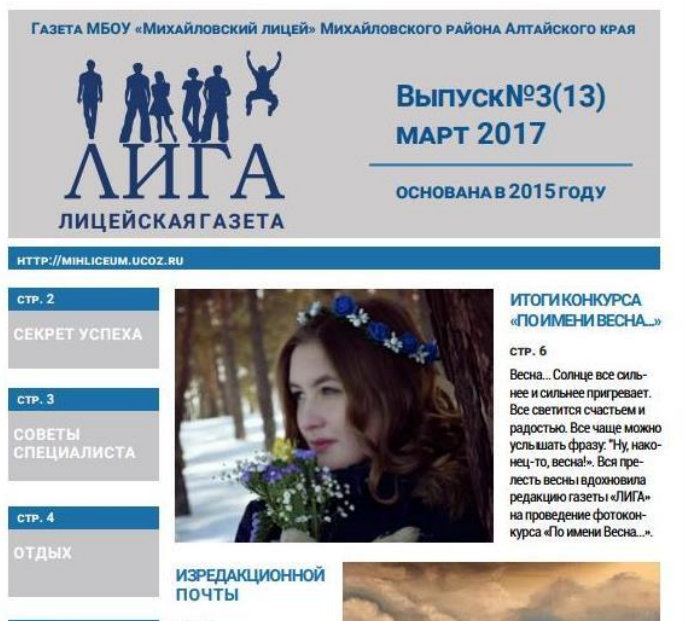
Фрагмент газеты «ЛИГА» выпуск №3 (13)

Подготовила к публикации Т. А. Жильникова.